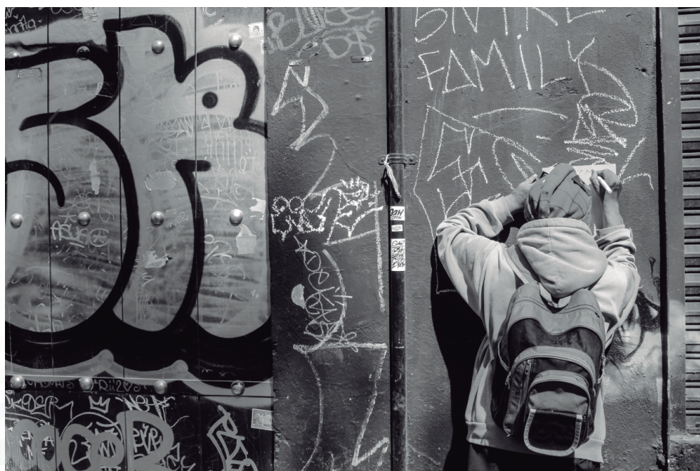
Portada del libro: Antropología de la calle