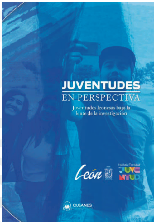
Portada del Libro: Juventudes en Perspectiva