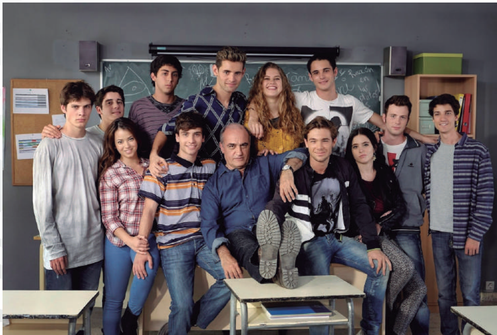
Merlí (VerandaTV, 2015).

...sí, pero aún lo es más el mundo en el que vives, hijo, todo está hecho una mierda pero no quiero que caigas en la decidía y en el pesimismo, quiero que te impliques en las cosas, que seas crítico con lo que te rodea ¡Sí! Ya sé que es un palo pensar en estos temas, pero es que no creo que los adolescentes solo tengáis en la cabeza el sexo y emborrachaos, también tenéis miedos, queréis experimentar cosas nuevas, pero estáis acojonados, sois como actores amateurs, antes de salir al escenario por primera vez... (Lozano, 2013).