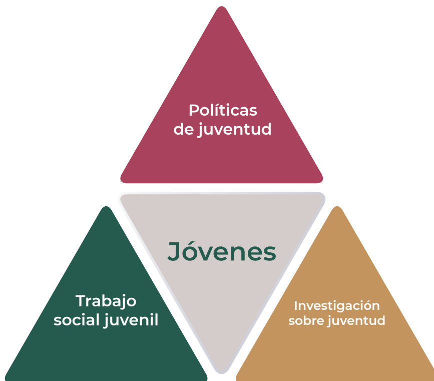
Figura 1: Políticas de juventud: ¿Triángulo Mágico o Triángulo de las Bermudas? (Planas, Soler & Feixa, 2014).