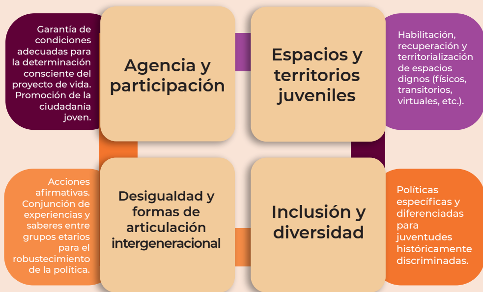
Figura 4. Descripción de ejes de la perspectiva de juventudes