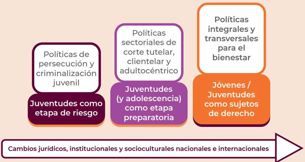
Figura 1. Devenir de las concepciones y modelos de atención hacia las juventudes

Vivencias propias, vinculadas a derechos que pueden ser ejercidos con responsabilidad y que (...) [exhiben expectativas que] remiten a situaciones existenciales plenas de legítimos reclamos para acceder a una educación mejor, para tener una atención completa en la salud, el respeto a su identidad, seguridad y vocación personal, el interés por una calificación profesional adecuada, para contar con políticas de apoyo para el primer empleo o una apertura adecuada a los bienes culturales, al deporte o al descanso recreativo (Bernales, 2012, p.21).