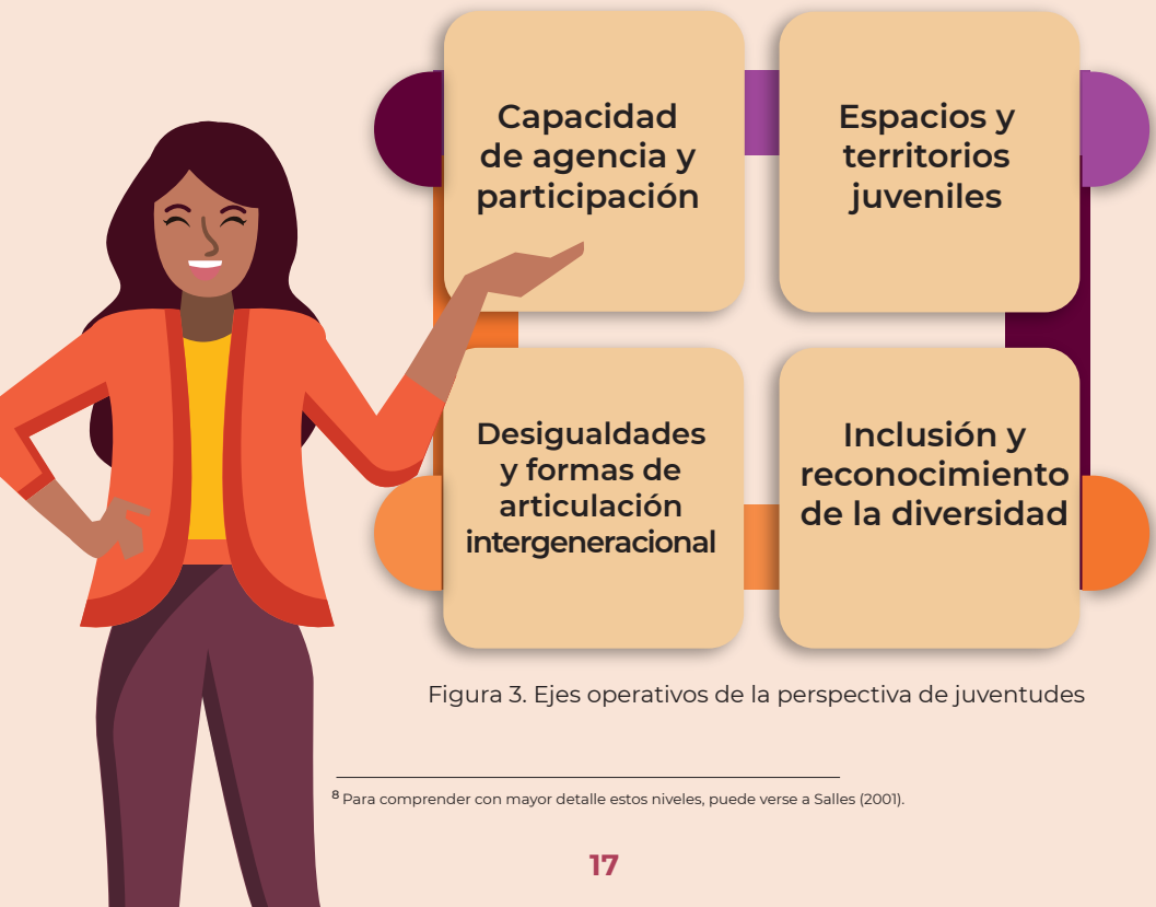
Figura 3. Ejes operativos de la perspectiva de juventudes

De tal forma que la puesta en práctica efectiva de esta perspectiva exige esfuerzos desarrollados a nivel micro, mezzo y macro, para lo cual se desarrollaron cuatro ejes operativos que, si bien son expuestos de manera individual, no operan de manera aislada ni excluyente, sino que se interpelan y funcionan de manera conjunta. Así, la PJ se centra en cuatro principales ejes: 1) capacidad de agencia y participación, 2) espacios y territorios juveniles, 3) desigualdades y formas de articulación intergeneracional y, 4) inclusión y diversidad.