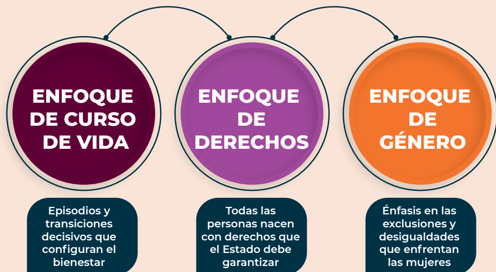
Figura 2. Principios de la perspectiva de juventudes

En su conjunto, estos elementos configuran los principios fundantes que dan forma a la PJ.