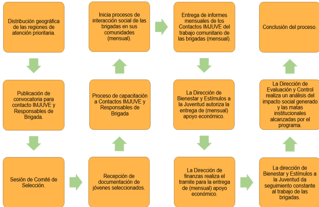
Figura 1. Ejecución del componente