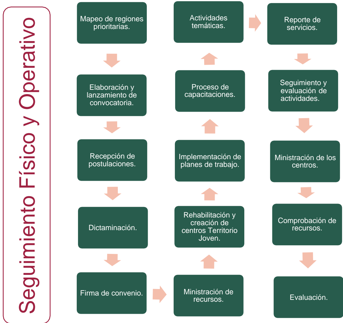
Figura 1. Componente Territorio Joven